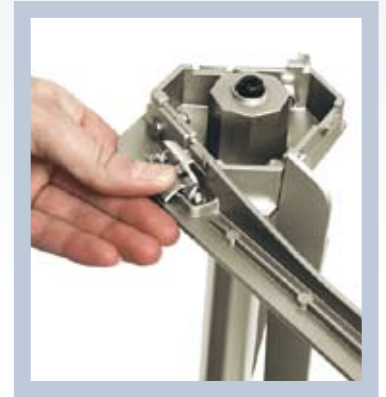
Tukijalat taittuvat helposti kokoon yhdellä napinpainalluksella.