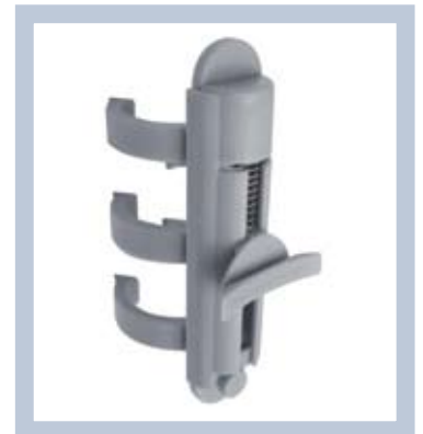
Alaosan jousikiinnitys pitää kuvan tiukalla. Tulokset ovat aina hienot!