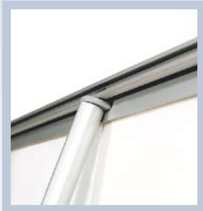
Tuki kiinnitetään ylhäältä. Siinä se!