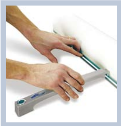
Yksityiskohtia myöten harkittu design. Tukijalka kiinnitetään alhaalta.